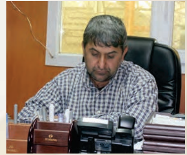
نویسنده: دگروال غلام علی جوینده

عدالت اجتماعی یکی از مکلفیت‌های نظام‌ها بر مبنای قوانین نافذه‌ی‌شان می‌باشد، اما تحقق آن در کشورهای ملل جهان تفاوت دارد. همانطوری که از نام عدالت اجتماعی هویدا است کشورهای که ضرورت و نقش آنرا در پیشبرد امور، حیاتی دانسته‌اند و آنرا در اولویت کاری قرار داده‌اند، امروزه در صدر کشورهای پیشرفته، مترقی و غنی جهان قرار دارند. اما در جامعه‌ی عقب‌مانده یکی از خلالهای عمده، عدم تحقق عدالت اجتماعی در آن کشورها محسوس می‌گردد. نقض عدالت عموماً از جانب رهبران و مسوولین دولتی با استفاده از امکانات دست‌داشته به‌منظور ادامه‌ی بقا و قدرت حاکمه و صحنه گذاشتن به بی‌اعتمادی بر اعمال نا شایسته‌ی‌شان قلمداد می‌گردد، این چالش‌ها در جامعه، باعث سرعت بخشیدن جعل، نادانی، خلالهای امنیتی، ضعف اقتصادی، فرار مغزها از کشور و سایر بحران و پدیده‌های شوم در عرصه‌های مختلف اجتماعی گردیده همچنان در صورت ادامه‌ی آن و دقت به ارزش‌ها و مزایای عدالت اجتماعی در جامعه‌ی بشری باعث کم‌کاری و ایجاد نظام‌های ضعیف که پاسخگویی نیازمندی‌های ساکنین آن کشورها نگردیده و بلاخره نه تنها ایجاد فاصله بین مردم و دولت می‌گردد بلکه از آن‌هم پا فراتر گذاشته و با استفاده از شرایط بوجود آمده غرض تحکیم بخشیدن سیطره‌ی افراد نفوذی‌شان را در جامعه استحکام بخشیده و در سدد ایجاد تشکیلات سازمان‌های سیاسی، گروپ‌های تروبیستی در راستای فعالیت‌های رعب و وحشت در جوامع می‌گردند و هر روز مردمان آن سرزمین‌ها را گواه جنگ، آتش، خون، دود باروت‌بوده و شاهد سوگواری قتل و کشتار عزیزان‌شان می‌باشند چالش‌های فوق بلاخره در جوامع، به ورشکست شدن نظام‌ها و سقوطشان منجر می‌گردد.