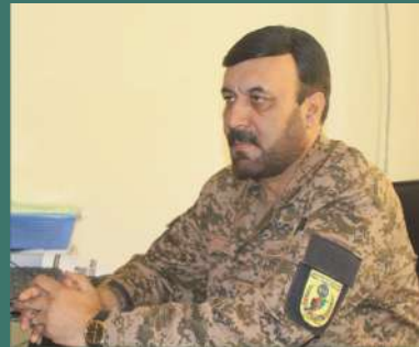
سمو نوال نور محمد راد مند